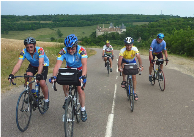
13) Supplément de route cycliste et touristique en roulant vers La Rochepot, pour voir son Château.