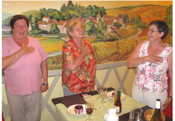
18) Et d'une cuisine bourguignonne aussi raffinée qu'arrosée : « On esteot fiers d'estre Wallons ! »