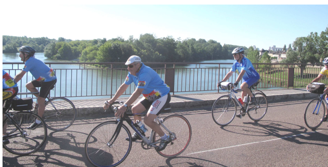
04) Quitte à s'instruire, comme ici à Verdun sur Doubs, avec la confluence du Doubs se jetant dans la Saône.