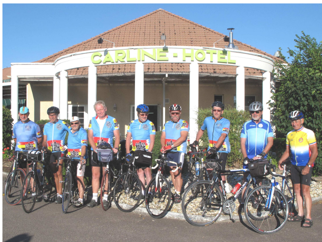
01) Dix chambres retenues à l'Hôtel Carline de Beaune ont permis à autant de cyclos de partir de bon matin.

Après 35 voyages annuels traditionnels dont on se souvient plus très bien, et après Sancerre et Azay le Rideau qui ont marqué les esprits, c'est à Beaune que les « Gens du Voyage » se sont fixés pour trois étapes en plaine de Saône et sur les coteaux de Bourgogne. Que du beau que du bon !