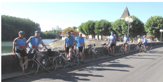
03) Un voyage d'été c'est l'ambiance cyclotouriste et amicale qui fait qu'on s'arrête souvent et volontiers.