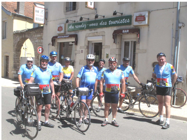
05) Ce premier jour, le Rendez-vous des Touristes à Seurre fut avant tout rendez-vous des Audax and Co.