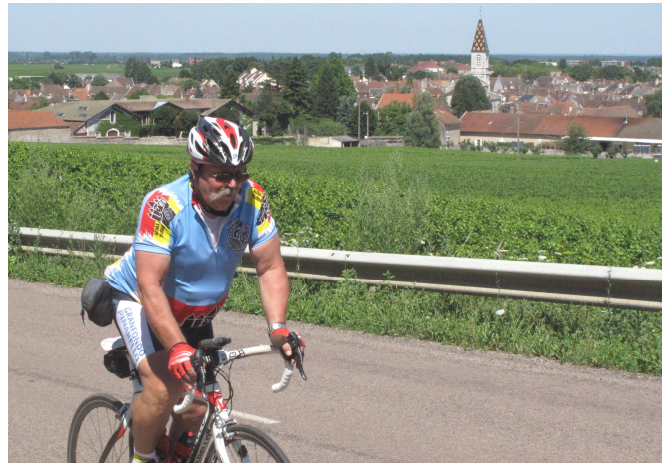
10) Quitte à gagner les Hautes Cotes de Beaune.