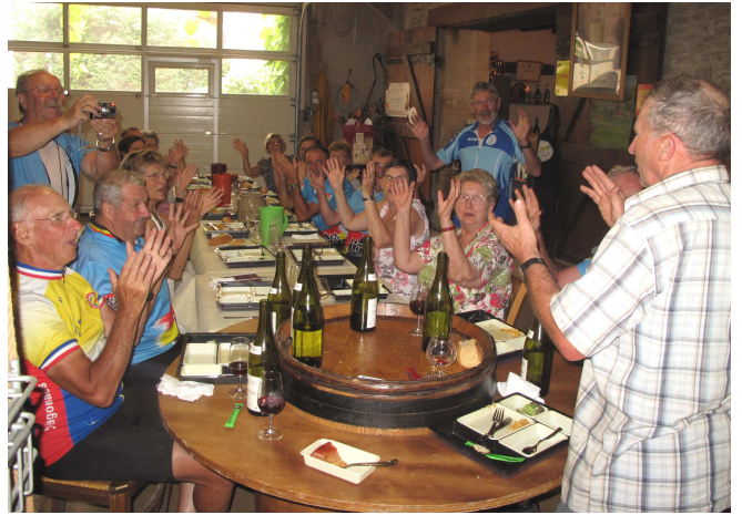
16) Incroyable dégustation à la table du vigneron chantant : « Et je suis fierr d'être Bourguignon ! »