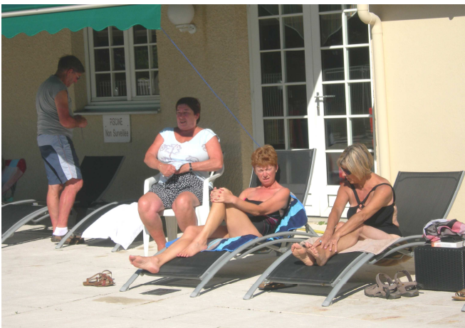
17) L'hôtel Carline, à 2 km de Beaune-Centre est d'autant plus agréable qu'il dispose d'une piscine.