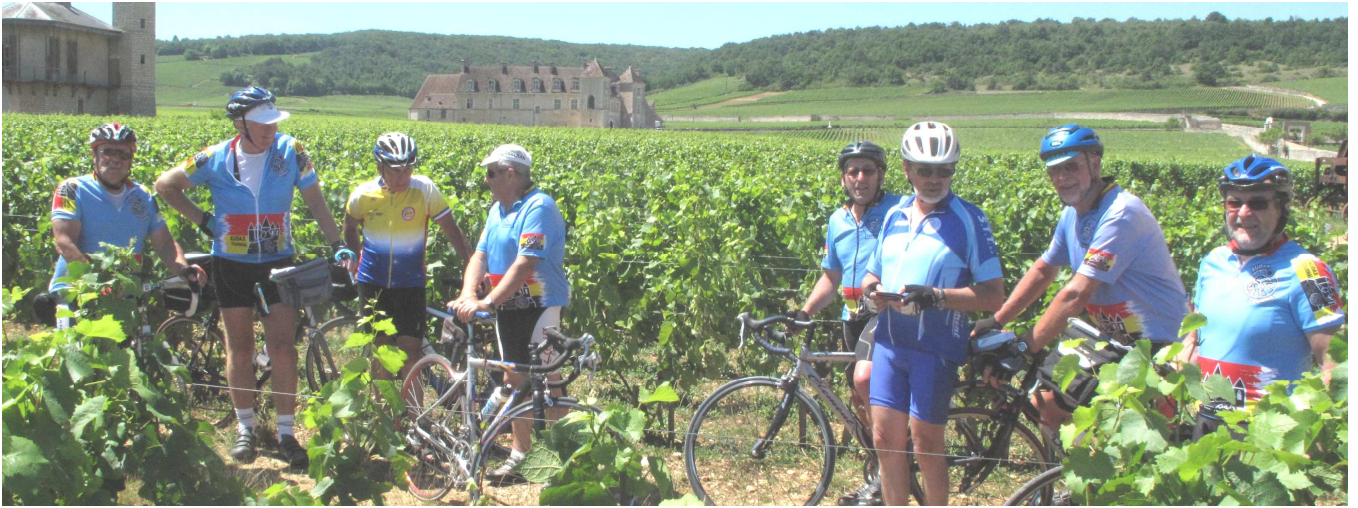
07) Autres grands crus de Bourgogne : Gevrey-Chambertin, Mercurey, Vosne-Romanée, Nuits St Georges, Santenay, Meursault, Chassagne-Montrachet, Saint-Romain, Pommard, Auxey-Duresses, Savigny-Beaune .