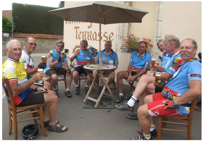
14) Et profiter de sa terrasse qui rappelle que les 3 étapes furent très ensoleillées.