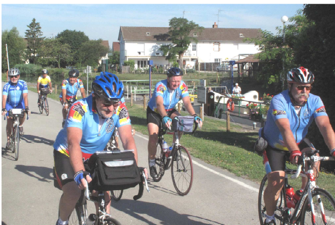
11) Mais on emprunte aussi les Voies Bleue et Verte.