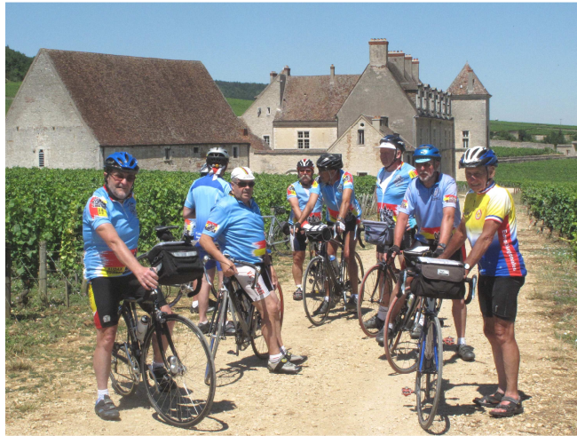
06) Le Tour de France ne se gagnant pas à l'eau, le Tour en Bourgogne a visité les Grands Crus : Clos Vougeot.